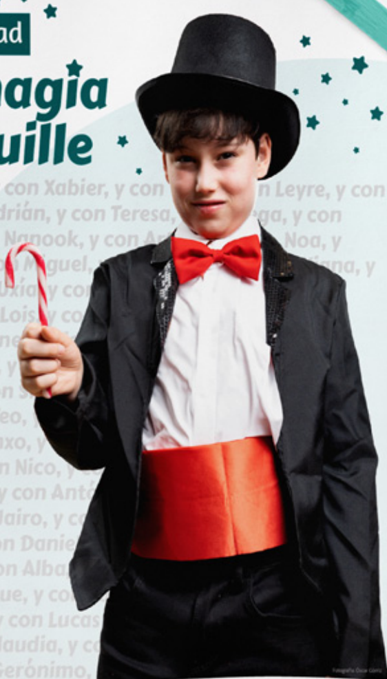
Cartel de la campaña solidaria, XII edición

Consigue en www.magiafegereces tu bastón de caramelo solidario. Gracias por colaborar con las enfermedades raras